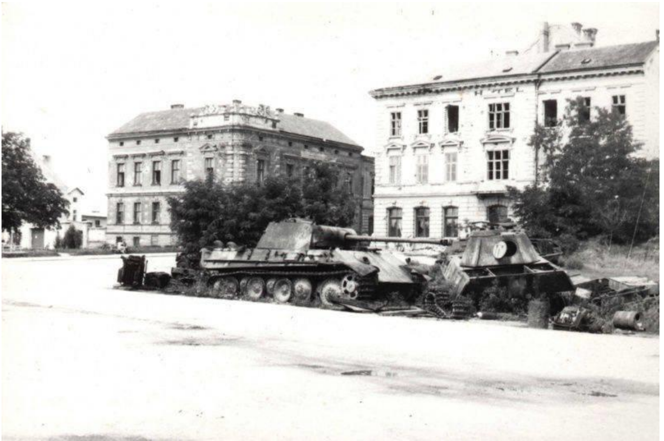
Разбитые немецкие танки «Пантера» на улице чешского города Зноймо