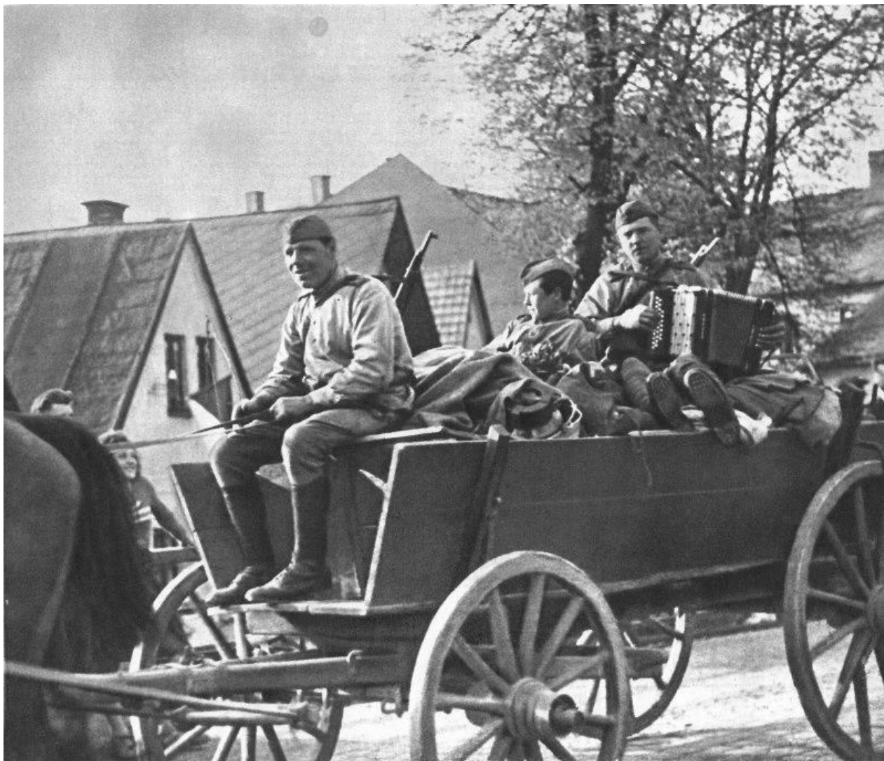
Советская колонна, приветствуемая местными жителями, проходит через чехословацкую деревню

Таким образом, за 10 дней наступления войска 2-го Украинского фронта взломали рубежи обороны немецкой армии на реках Грон, Нитра и Ваг, захватили Братиславский укрепленный район, освободили несколько сотен населенных пунктов. Всего два дня понадобилось нашим войскам, чтобы взять Братиславу. Со стороны Братиславы открылась прямая дорога на Вену.