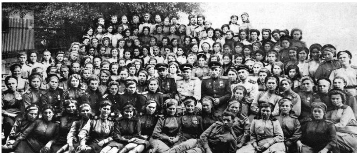
Групповой портрет военнослужащих 329-го зенитно-артиллерийского полка в городе Комарно

гвардейским стрелковым корпусом 7-й гвардейской армии, наступавшим с фронта, начал наступление на Братиславу междуречьем Дуная и Малого Дуная. Этот удар резко ухудшил положение противника, разваливая его оборону.