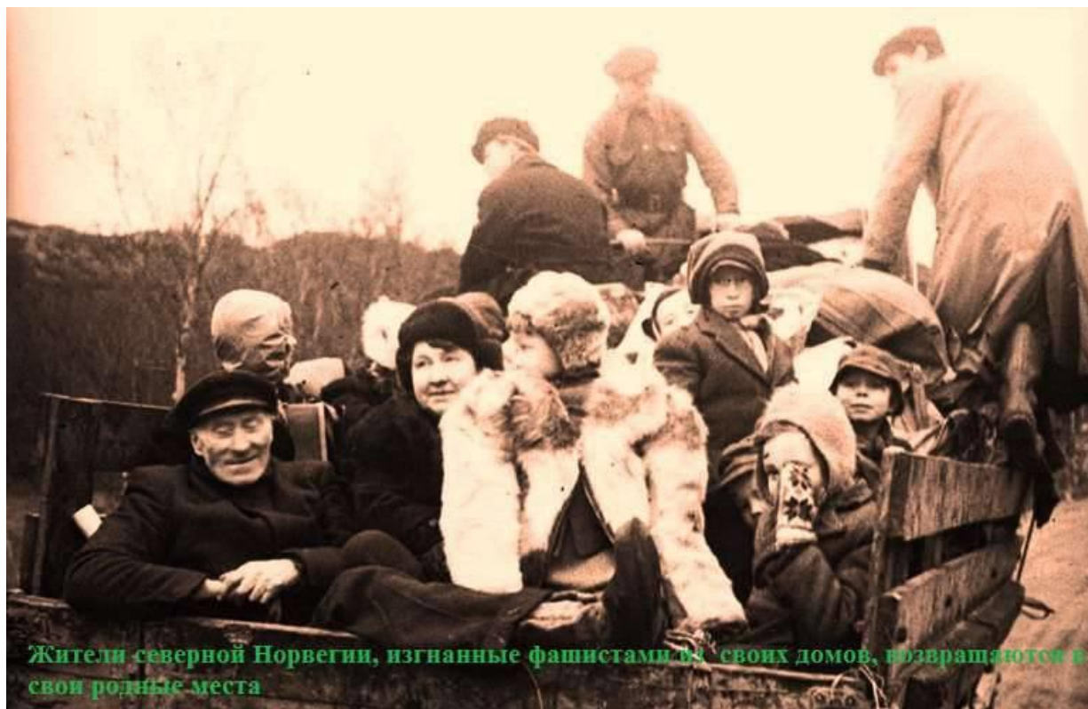
Жители северной Норвегии, изгнанные фашистами из своих домов, возвращаются в свои родные места

командование 14-й отдельной армии (с 15 ноября она перешла в непосредственное подчинение Ставки), дополнительно открыло 6 больниц. Много больных было помещено в армейский госпиталь. В разрушенных городах советское командование не занимало оставшиеся целыми здания, а предоставляло их под жилье норвежцам, оставшимся без крова.