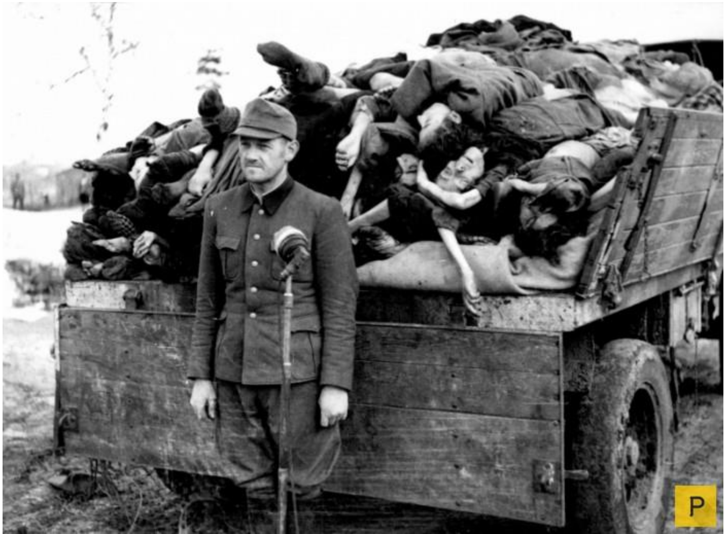
Бывший оберштурмфюрер СС Франц Хёсслер (Franz Hößler, 1906—1945) у микрофона перед грузовиком с телами узников концлагеря Берген-Бельзен.