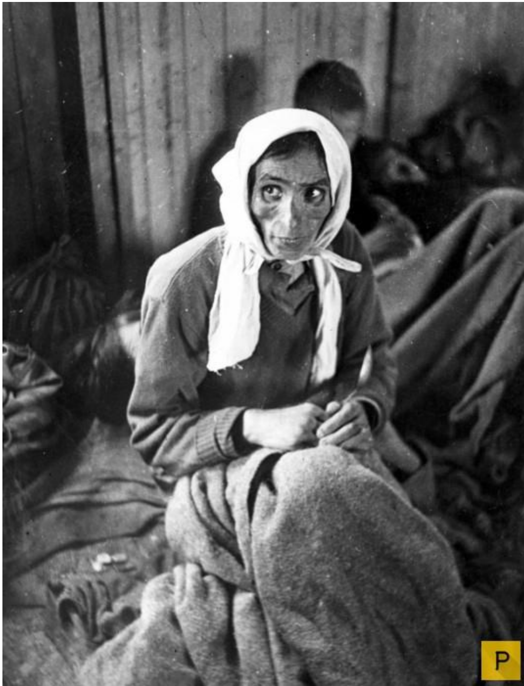
Освобожденная узница концентрационного лагеря Берген-Бельзен, заболевшая тифом в одном из лагерных барачков.