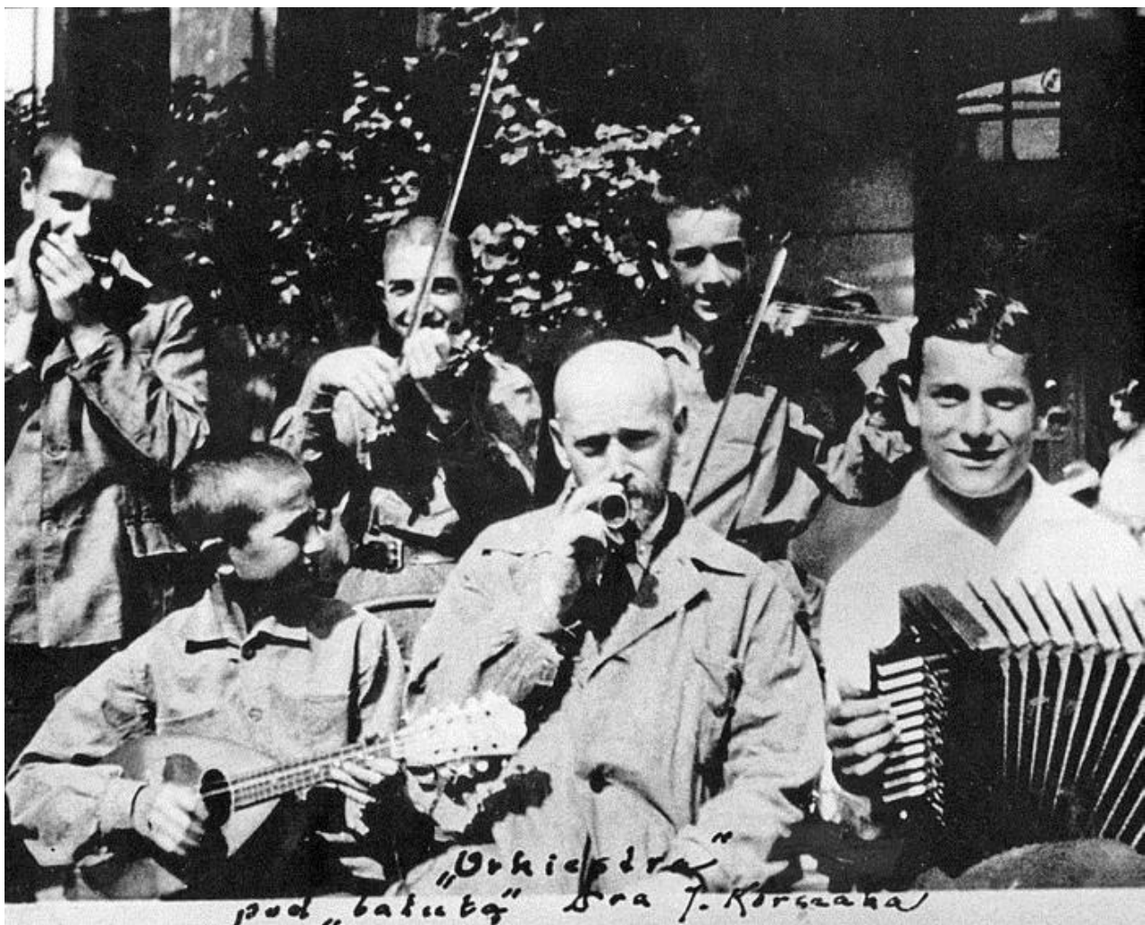
Дом сирот. Оркестр под управлением Януша Корчака