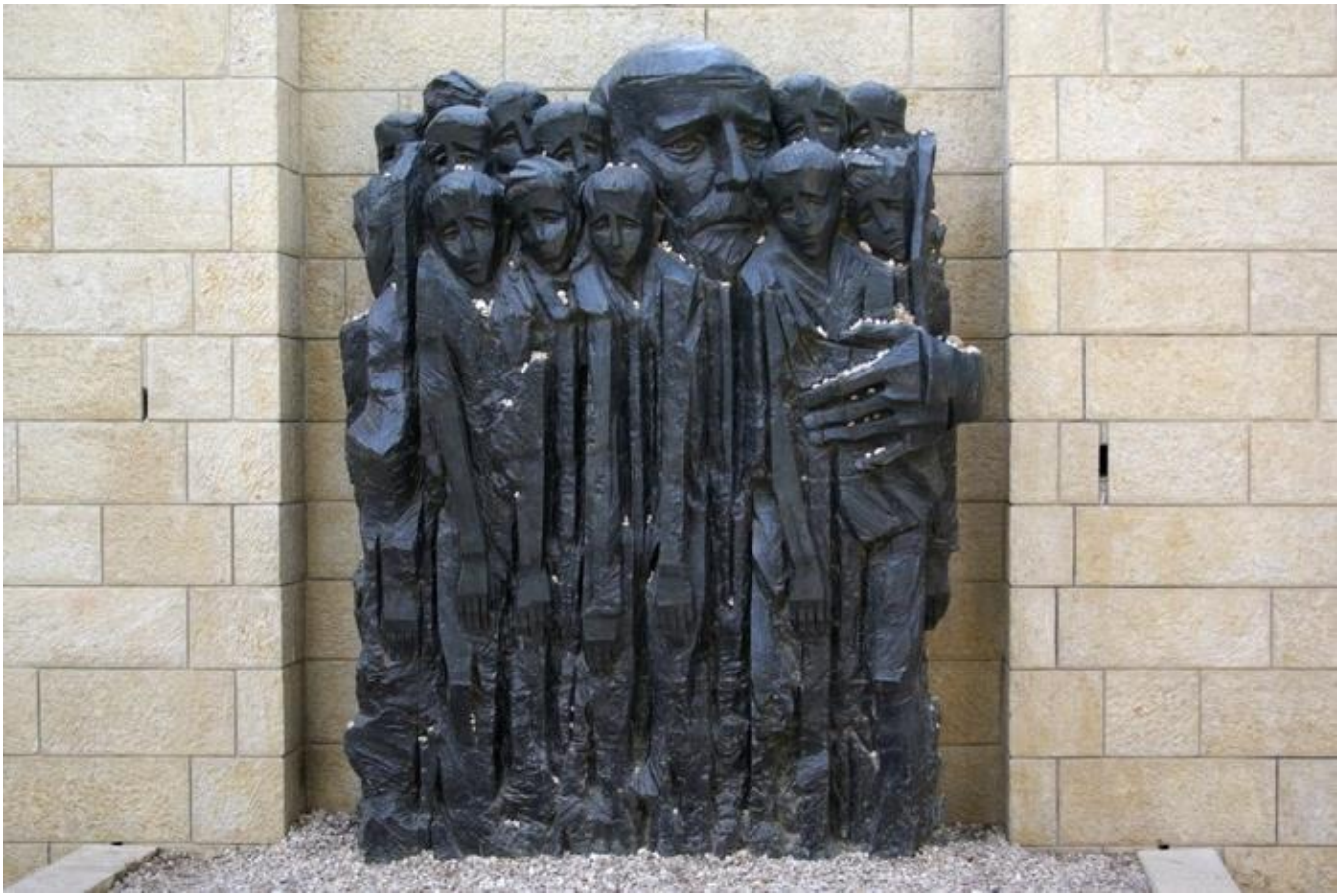
Памятник «Януш Корчак с детьми» в Иерусалиме